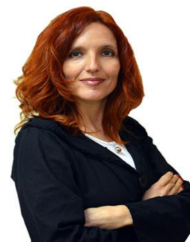
Slađana Đukić, pomoćnik ministra Ministarstvo zdravlja Republike Srbije