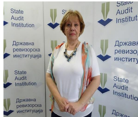
Snežana Trnjaković, vrhovni revizor

Republički fond za zdravstveno osiguranje