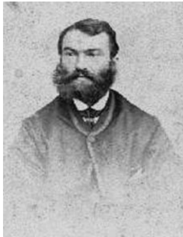
Džejms Parkinson (1755–1824)

"Rođen kao englez, podizan kao englez a zaboravljen od engleza i većine sveta – to je bila sudbina Džejmsa Parkinsona" 1 .